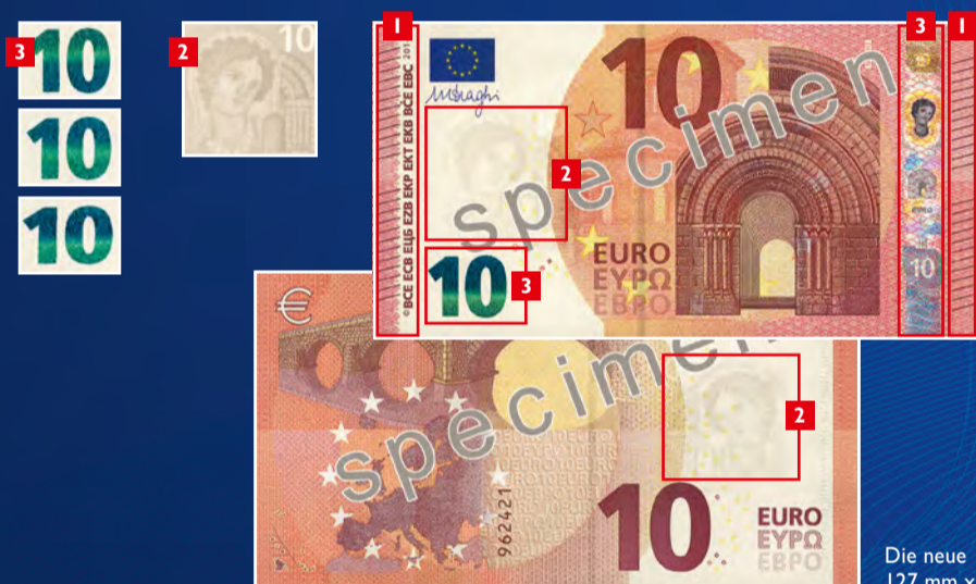
Die neue 10-€-Banknote 127 mm x 67 mm